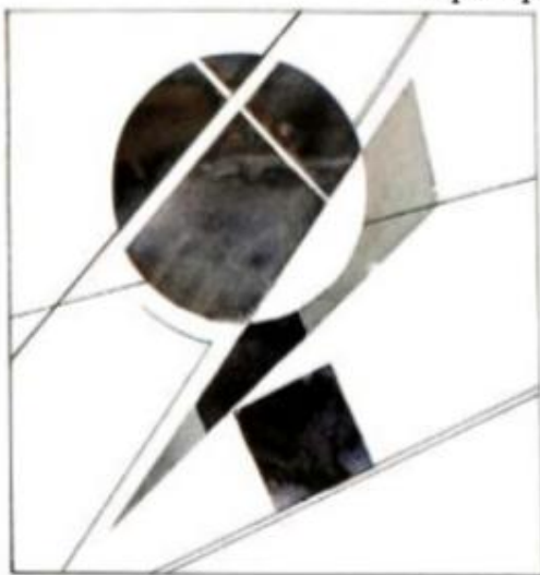
Примеры выполнения задания 1: